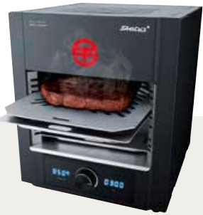
1. Preis: ein „Power Steakgrill“ PS M2000 DEVIL von Steba

Drei Fragen beantworten und attraktive Preise gewinnen!